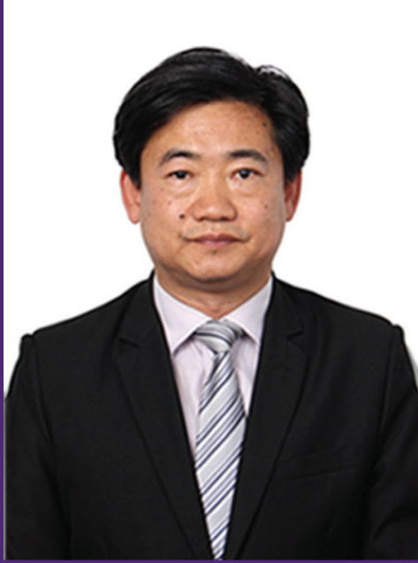
السيد/ تشاو تشونغ

القائم بأعمال سفارة جمهورية الصين لدى بلادنا