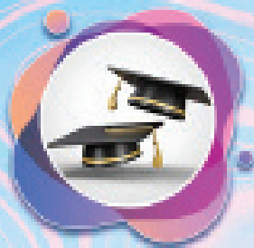
بكيل غنبل جامعة شانسي للمعلمين تربية مقارنة ودولية