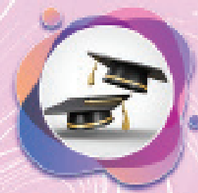
أيمن منظر حزام الرصاص جامعة الصين البترول (شرق الصين) هندسة بترول