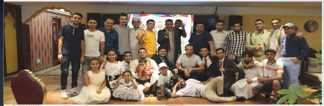
صور تذكارية للحاضرين في فعالية عيد الاضحى المبارك

من فعاليات العيد الرقص الشعبي حيث رقص العديد من الحاضرين الرقص اللحجي والبرع وغيره وفي الساعة الرابعة عصرًا تحرك الجميع للمشاركة في نشاط لعبة البولينج برعاية كريمة من شركة عبدالمملك الحداد وقد تنافس الشباب في مجموعات صغيرة وقضوا وقتاً ممتعاً في نادي البولينج