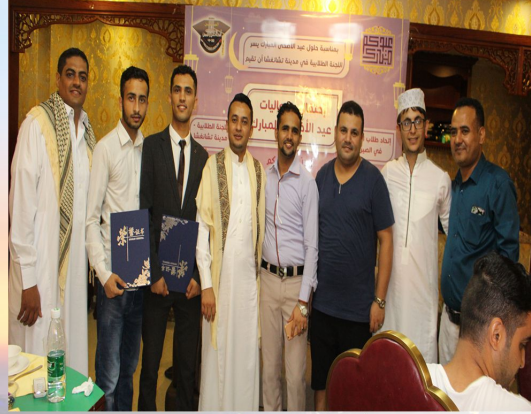
أعضاء الاتحاد السابق

صور من تكريم اللجنة الطلابية السابقة لمدينة تشانغشا من خلال فعالية عيد الاضحى المبارك ومن هذا المنبر نود أن نعبر عن عميق إمتناننا وجزيل شكرنا لجميع افراد اللجنة الطلابية السابقة لما قدموه من جهد واجتهاد في العام الماضي بما فيه الأنشطة الرياضية والثقافية والاجتماعية. لا يسعنا سوى أن نقول لكم شكراً جزيلاً ووفقكم الله لما فيه من خدمة الطلاب والطالبات والشعب اليمني والعربي كافة